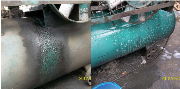
ภาพสาธิต ก่อน-หลัง การทำความสะอาดโดยใช้น้ำยา Star Clean