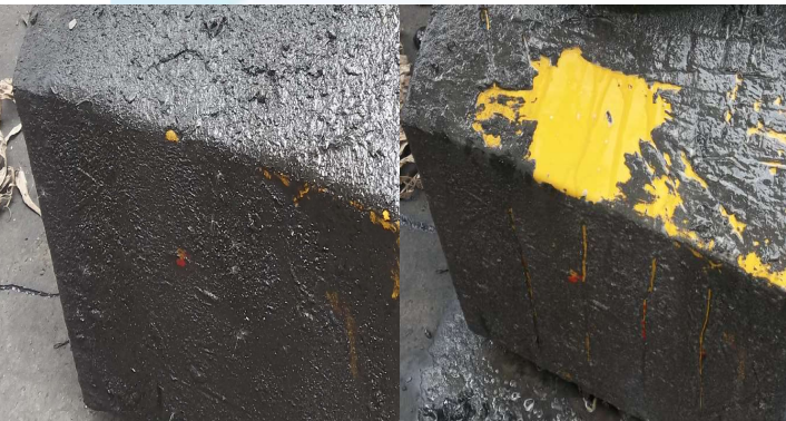
ภาพสาธิต ก่อน-หลัง การทำความสะอาดโดยใช้น้ำยา Star Clean